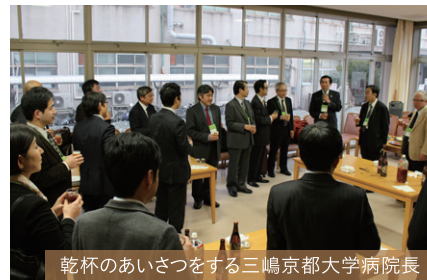
乾杯のあいさつをする三嶋京都大学病院長