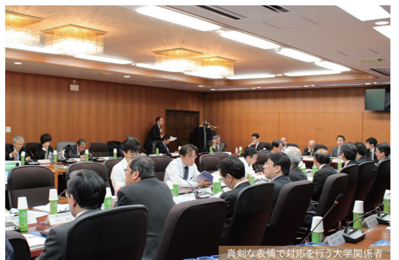
真剣な表情で対応を行う大学関係者

場所 岡山大学医学部 管理棟3階 大会議室 日時 平成26年1月31日(金) 13時～16時30分